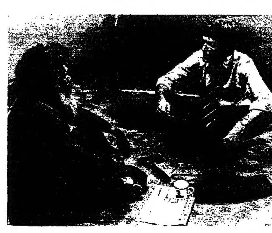
المعلمي حبيد (ويشار شيرلان) والمعزج الأسود (أماجولا) في فيلم «الموجة الأخيرة»